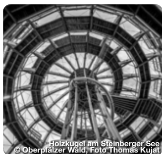
Holzkugel am Steinberger See

Huskyabenteuer – nordisches Feeling im Bayerwald Auf den zwei Huskyhöfen Dreisessel in Altreichenau und Haus Waldschrat in Frauenau können Urlaubsgäste mit den geselligen Hunden auf Tuchfühlung gehen sowie Workshops und Schlittenhunde-Ausfahrten buchen. Gerade im Winter, bei Eis und Schnee, sind die Hunde in ihrem Element – ein unvergessliches Erlebnis für die ganze Familie. TreffpunktDeutschland.de/bayerischer-wald