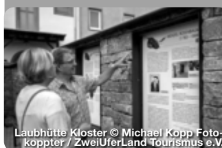
Laubhütte Kloster