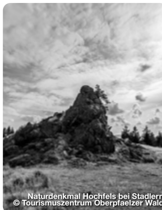
Naturdenkmal Hochfels bei Stadlern