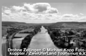
Drohne Zellingen